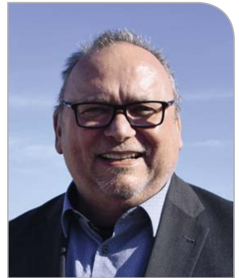
Peter Dieterich Bürgermeister der Gemeinde Stein